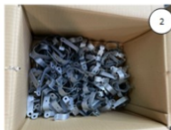
Abertura da embalagem e disponibilização para produção