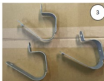
Os suportes disponíveis para o processamento na fábrica do Brasil