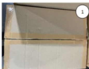
Os suportes são recebidos em embalados em caixa da origem